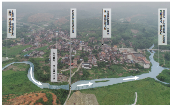
图2 大布村存在问题现状分析图

大布村虽然拥有丰富的天然资源，但相对较为单一，未能多元化发展，且配套设施并不完善，影响产业经济的布局和发展。