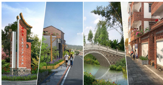
图3 大布村道路、水系、建筑营造效果

从大布村的传统文化与古建筑中提取文化重点突出大布村的文化特色并进行深入研究推广。首先对大布村的建筑逐一进行清点,划分需要保留和整改的类型,古建筑及特色建筑予以保留进行维护和修缮,对残破建筑和近代建筑进行拆除或整改 [9] ,拆除或整改后的新建筑加强装饰特色,打造古今融合的新式居住建筑,公共建筑也以此为标准,统一打造古色古香的本土风格建筑景观,增添大布村的特有的文化风韵。