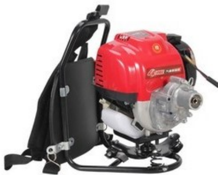
图2 污水处理厂构筑物施工中混凝土振捣所用的插入式振捣器

对于砼的振捣来说，本项目工程所使用的振捣器为插入式振捣器（如下图所示），且应严格遵循“快插慢拔”的使用原则，保证插点能够均匀的、按照顺序进行排列，这样才能够尽可能减少或避免遗漏现象的发生，使得整个振捣工作更具稳定性和均匀性。