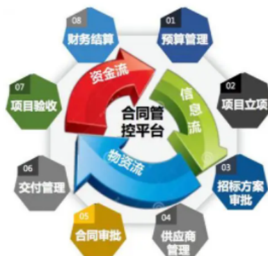
图1 合同管理流程图

建设项目合同是由承包商和建设单位签署的一份具有合法效力的合同，由承包商和承包商按照有关协议进行建设，以确保项目的正常进行。建设项目契约起着制约各方作用的作用，依据规章对建设项目的各方面进行有效的监控和控制，通过依法行政来减少建设项目的费用支出，使建设项目的投资稳定性得到提高。在建设项目建设中，合同的质量与效益对于建设项目建设的发展起着举足轻重的作用，而一个完备的契约体系（见图1）则可以对建设项目的各方面进行科学而又高效的控制，保证整个建设项目的质量。所以，在建设项目中，业主必须严格遵守合同规定，遵守有关的法规，确保建设项目的安全，并以合同的法律效果来规范双方的行动。目前，我国的建设事业发展迅速，但由于建设项目的合同管理在某些方面仍有缺陷，对建设项目的稳定产生不利的作用，因而，建设单位应加强对建设项目的管理。