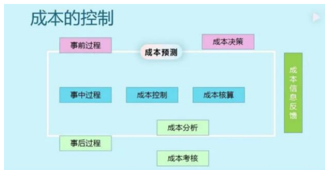
图3 建筑工程合同成本控制

现项目建设中的数据集成与分享，确保数据的精确度，提高建设项目的工作效率和工作品质。