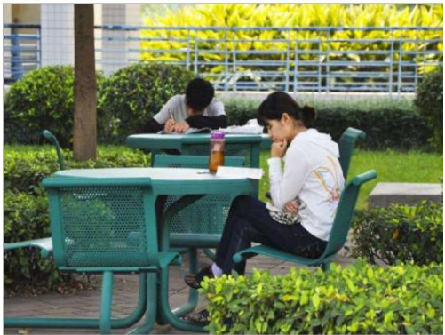
图2-4 学生对独处型与对话型空间的使用