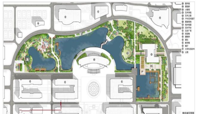
图2-3 景观湖区平面图

建成后的景观湖区成为了河南工业大学新校区的标志。它兼顾生态和景观，为校园提供了一个绿肺，不仅成为学校师生最佳的休闲活动去处，也成为附近居民假日游赏的好地方。