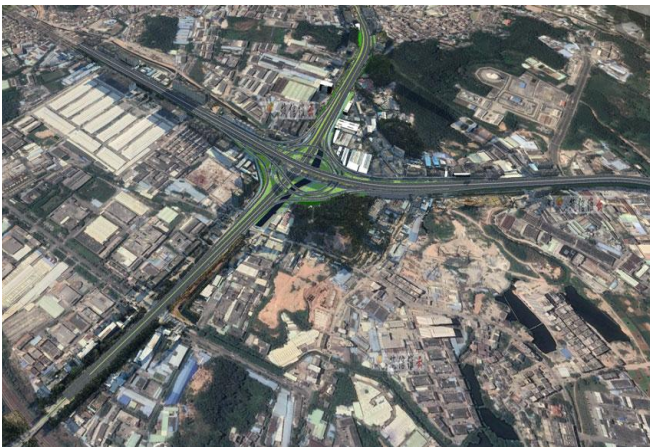
图2 GIS系统平台测绘数据成果

利用GIS系统平台对土地利用空间数据进行处理，能够提升处理信息的规范化程度。值得注意的是，考虑到计算机对数据的输入、输出需求能够有效适应，然后使相关要素能够进行比对、运算，并将数据、影像信息统计处理，基于数据处理前期，需确保格式的统一性，以此体现数据信息的规范化，而对于GIS系统平台则能够实现这一目标 [4] 。与此同时，GIS系统空间还具备突出的时序性特点，可对某一特定时间范围的数据进行搜集、计算，进而将数据信息的时序性特点有效展现出来。此外，在一系列处理的基础上，融合测绘技术，可导出测绘成果，如下图2所示，为GIS系统平台测绘数据成果。