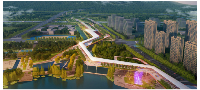
图3 山水空中走廊鸟瞰图

主题4：城市互动穿越线——强化新时代城市风貌，穿城的体验，“未来、科技”之线。全长14.2公里，穿城而过，过五龙山公园、诺贝尔公园、浒光运河、净水公园（新增）、智慧树亲水公园（新增）、科技互动广场（新增）、生态廊桥等节点，上跨绕城高速直达大阳山。提倡“拆栏透绿”，打造公园绿地与绿道融合的开放环境，构建阳光草坪等城市营地场所。诺贝尔湖至大阳山绿道断点，用地置换，联系大阳山和城市的山水走廊、立体公园。向阳而生的“智慧树”延续山水走廊、链接城市板块、增强互动体验（见图3）。