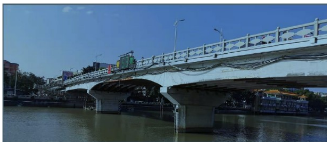
图1 市桥大桥现状图

梁，每跨由7片T梁组成，该桥全长294.12米，桥梁共21跨，跨径组合为： 8 \times 10\text{m} + (21\text{m} + 29\text{m} + 34\text{m} + 29\text{m} + 21\text{m}) + 8 \times 10\text{m} ，引桥均为普通钢筋砼简支T梁，下部结构为柔性薄壁式桥墩，钻孔灌注桩基础，支座采用板式橡胶支座。