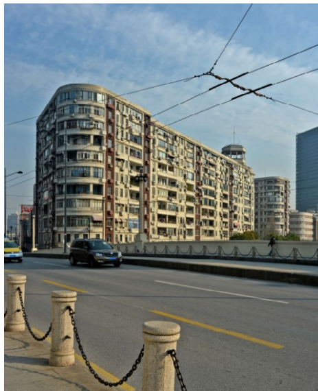
图1 河滨大楼外视图

河滨大楼作为上海市得以留存的经典公寓，开窗便是苏州河与黄浦江的双重水晶，作为上海最早一批的滨水公寓，在城市更新过程中历经多次改造，使得河滨大楼急需改造修缮（见图1）。但是作为85年房龄的建筑，房屋现状尤为复杂（见图2），需要从室外重点保护部位外立面，室内重点保护部位公共区域，民生诉求等方面，最终确定河滨大楼的重点保护与修缮方案。