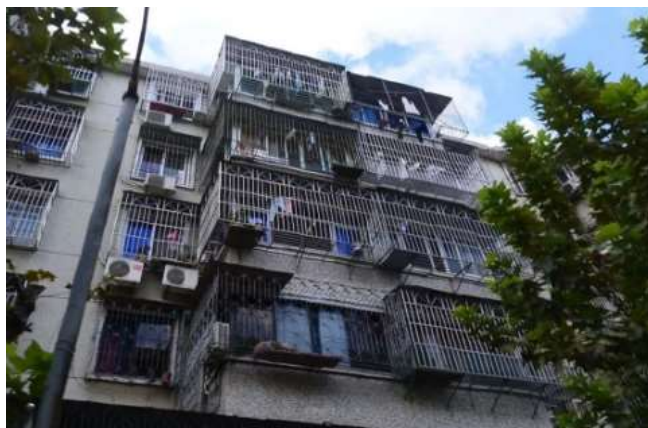
图二 老旧小区防盗网违建

第一，建筑物自身方面的问题。老旧小区内的建筑物经过多年的风吹雨淋，再加之平时缺乏保养与维护，导致其性能随着时间的推移不断退化，建筑物外围出现大面积破损的情况，并且很多建筑物并未设置保温层与双层玻璃，这也导致老旧小区能源消耗较高，而碳排放量超过现阶段实行的标准。另外，老旧小区内建筑物立面一般都存在有脏污和缺损的情况，并且还存在违建的情况，像雨棚、防盗网等，如图二。致使小区整体视觉效果较为凌乱，缺乏美观度。