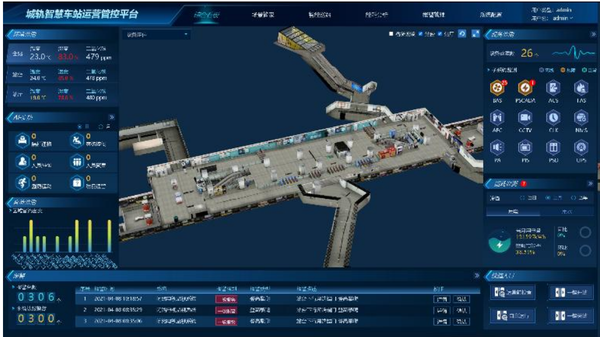
图2 智慧车站综合看板