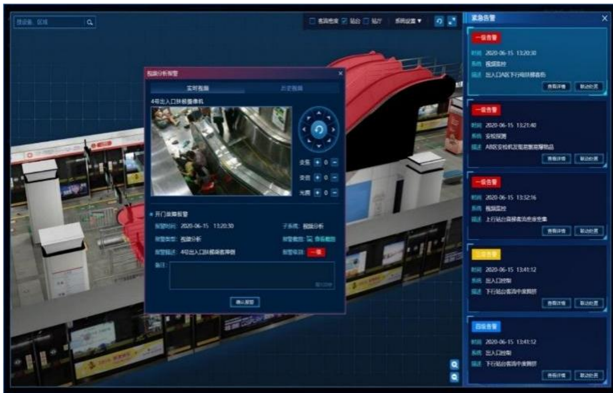
图3 视频AI识别乘客扶梯摔倒