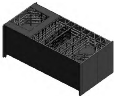
图1 深基坑支护结构BIM模型

chitecture 及 Revit Structure 开展基坑支护三维建模设计,完成深基坑支护结构、地下室结构模型、土方开挖模型及支撑加腋节点的钢筋模型。应用软件建立深基坑支护结构三维模型,如下: