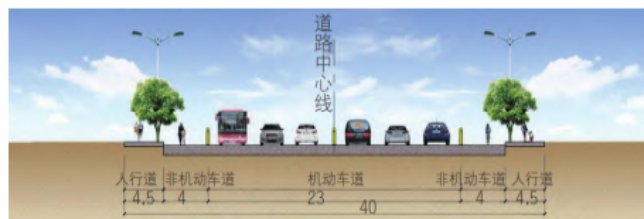
图1 某市政道路规划标准横断面示意图 (单位: m)

针对基础道路网络结构设计问题进行的改造可以包括改变道路网格结构、扩大道路宽度、改造交叉口、增加道路设施和增加道路绿化等措施。这些改造措施可以提高道路的通行能力、行车舒适度和环境质量，从而提高城市交通发展水平和居民生活质量。