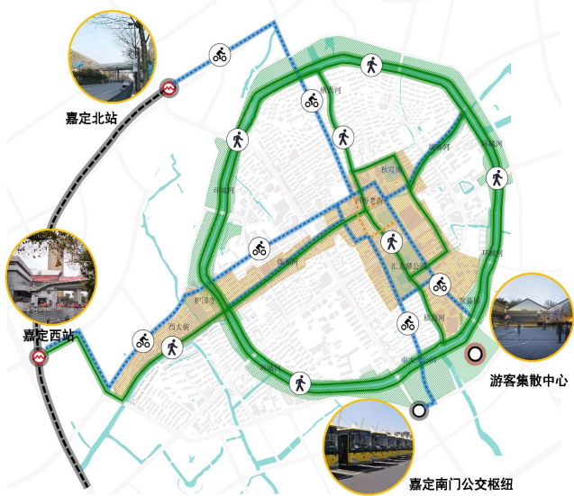
图3 嘉定特色慢行路径设计