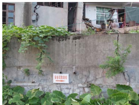
照片 重点勘查区禾梨坳集镇老榨油厂滑坡后缘房屋变形情况