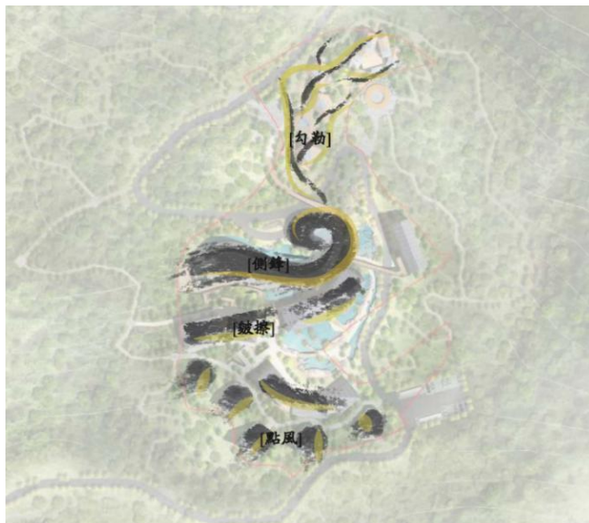
图2 功能布局与国画技法的写意结合

e. 点睛（室外汤池区）：温泉汤池区位于画面的最中心，将周围的建筑与环境相融，让建筑的意境得到烘托升华，使画面更加生动而有力。