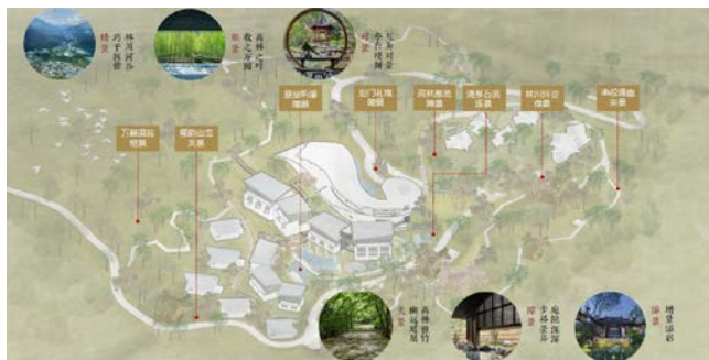
图5 建筑与景观八景

通过对山水画卷中的元素与意境提取，再曲径通幽、清泉石流、悬坐听瀑、迎门礼境、高林葱茏、万籁俱寂、山川河谷、蜀韵山峦现等八个场景，融入场地，因地设景。在八处主要景点的烘托下，将建筑与自然通过景观巧妙链接。