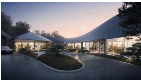
图6 酒店大堂透视效果

酒店大堂造型取至于抽象的鱼鳃图腾和彭州当地传统民居元素，采用曲面流线的坡屋面，形成现代与传统的对话与碰撞。酒店建筑材料语言方面，选取天府文化具有传统意蕴的当代材料（木瓦屋面、竹木拼板、藤帘、山地毛石），融于自然环境，生态和谐环保的同时，也充分体现设计在地性的特色。