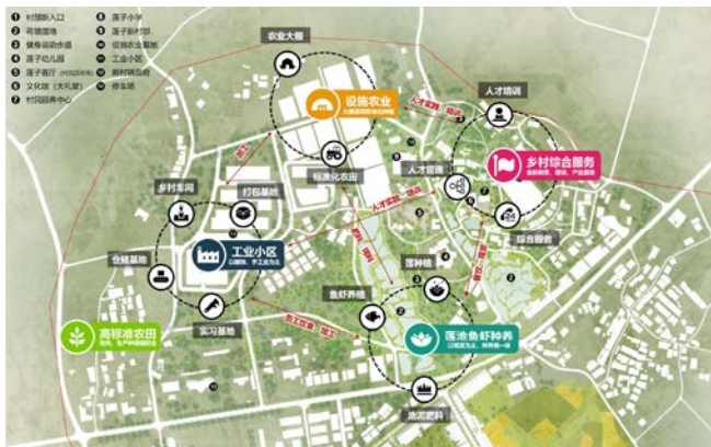
图3 产业公共服务区总平面及产业公共服务区产业布局图

收集点。针对区域内的道路交通设施、场地竖向设计、市政管线布局、环卫设施布局以及标示小品布局，根据现状条件，结合相关规范要求，做全面的空间设计与布局，全面指导示范区的建设。