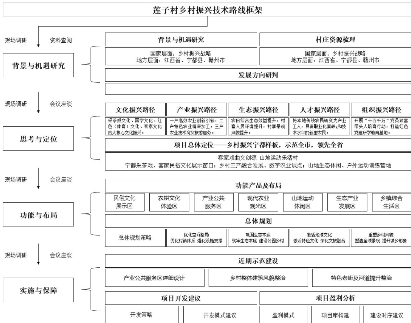
图1 莲子村乡村振兴在总体技术路径图（作者自绘）

结合村内现状条件及人文资源，以文化活力、产业活力、生态活力作为发展核心，以“客家戏曲文创源-山地运动乐活村”作为莲子村未来总体定位，打造宁都采茶戏、客家民俗文化展示窗口。