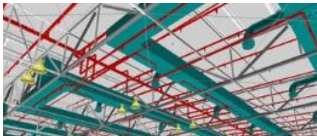
图3 建筑电气管线示意图