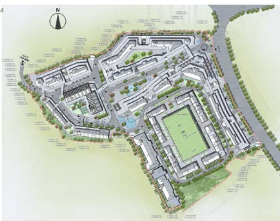
图1：黄果树各国里项目总平面图