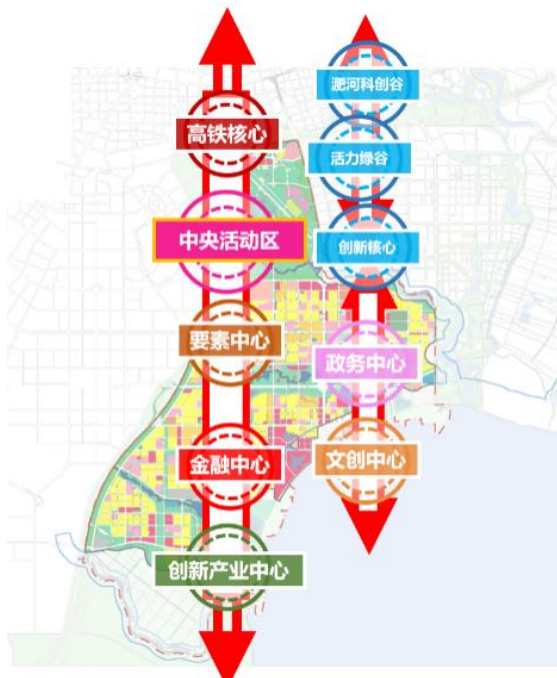
图三 内部发展轴线