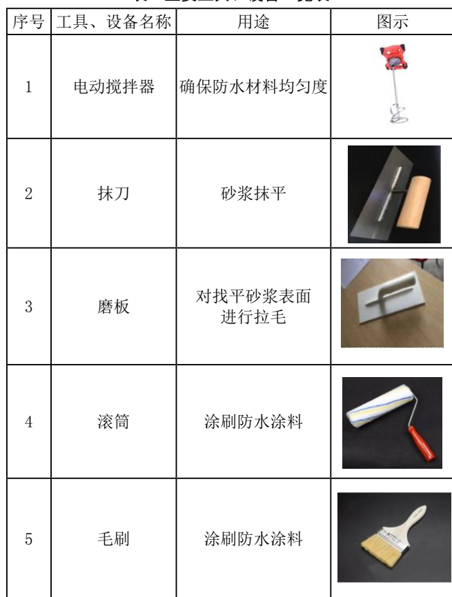
表2 主要工具、设备一览表