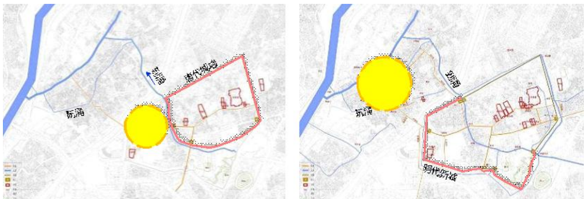
唐代和明代的莞城范围