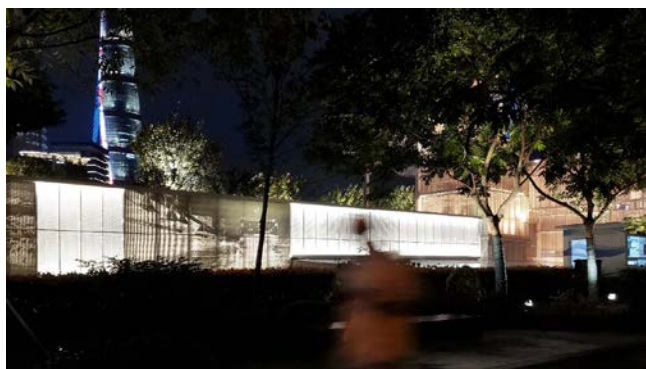
图4 艺术景墙与建筑门廊的交错延伸，肌理虚实呼应

艺术景墙作为建筑门廊的交错延伸，与其表皮肌理虚实呼应，达到景观建筑元素一体化。主题手绘素描画面采用参数化穿孔铝板，白天以城市素描照片的形式再现码头记忆，晚间结合穿孔铝板内柔和透光，变幻成黑白胶片映画重现历史时刻（图4）。同时，在有限的空间里将时间的切面展开，讲述一系列关于十六铺光影故事，诠释出地理与时间层面的珍贵记忆。