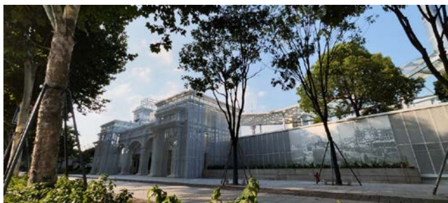
图3 历史景墙与更新码头时空对话

段历史时期的码头景象：19世纪30年代商贸崛起，码头成为货物集散中心，江边店铺林立，人烟稠密 [3] ；19世纪40年代商贸进一步繁荣，万商云集，江面舳舻相接，帆樯栉比；20世纪初：上海开埠后，内外贸易日益增长，大量海外轮船进出码头 [4] 。20世纪20年代：十六铺北段金利源码头盛兴氛围，行人往来不断，通往沿海各地，2003年：“紫竹林”号最后一次停靠更新前的十六铺码头 [5] 。