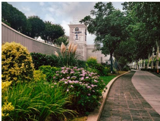
图2 十六铺1号码头崭新风貌全景窗口

同时，从文化传承及码头运营的角度考虑，对沿街进行形象展示界面与休闲共享界面的双重优化。从文化传承角度，充分挖掘十六铺码头历史记忆元素进行户外展示，通过特色的艺术化设施等传递文化信息，打造市民记忆中的活力文旅大道。从码头运营角度，打造十六铺码头侯船集散广场，增加活动休憩功能和人性关怀体验，因地制宜打造广场地标，疏散人流。本次更新设计，旨在优化浦江公共服务码头区内各类基础设施建设，更好地塑造黄浦江沿岸公共空间，提升浦江文化旅游的品质与形象。（图2）