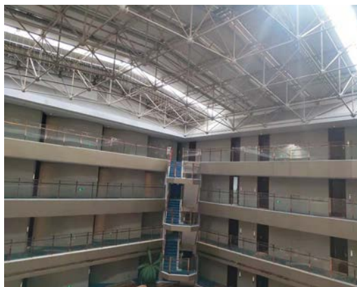
图2 青岛海情康养中心改造项目内部原貌

由于项目的特殊性，需现场复核现有设备是否满足需求，问题也随之暴露出来，比如：屋顶原有消防风机老化严重，且风机压头不满足使用条件，根据新规要求，设置专用风机房，并更换参数匹配的风机；原有新风机组的过滤器长时间未更换，甚至已经破损等等，如图2。根据业主要求，尽可能利用原始设备，节省改造成本，大部分的老年人居住公寓是可以利用原有风机盘管夏季制冷、冬季制热，但个别房间因西晒朝向或者房间外窗大小的影响，经计算后复核房间的冷、热负荷，原风机盘管已不满足用户使用需求，需调整风机盘管型号，同时还需复核管井内立管尺寸是否满足现有需求。由于一层局部区域新增了医疗服务区，空调使用时间与公寓不一致，空调系统需按功能、区域、使用时间重新调整划分，经实地探勘后决定，由地下一层冷冻机房内增加一路空调水路，利用楼梯间边上的储藏间掩藏空调水立管上供至医疗服务区域制冷、制热，同时也方便后期维护与管理。