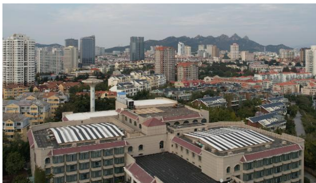
图1 青岛海情康养中心改造项目外部视角