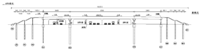
图2-1 天桥桥型布置图

本桥为曲线异形连续钢箱梁，主线跨径布置为（3.2m+7.5m+7.53m+9.88m）连续钢箱梁+（25m+60m+25m/35m）连续钢箱梁+（5.72m+7.5m+7.5m+3.2m）连续钢箱梁；支线梯道1跨径布置为（8.7m+7.5m+3.5m）连续钢箱梁；支线梯道2跨径布置为（6.595m+6.345m+2.675m）连续钢箱梁。