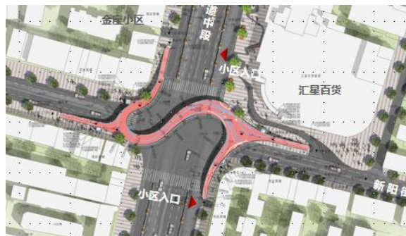
图1-3 天桥平面布置图

降低桥梁跨径，太和大道为城市南北主轴，为城市主干道，设置双向6个车道，若在路口中央设置桥墩，不但影响太和大道整体景观，同时对交通影响较大，同时存在安全隐患。故考虑在汇星百货侧广场边及对角处设置桥墩，这样主桥跨径60m左右，钢箱梁采用整体曲线变宽造型，主墩采用四肢钢管柱。能满足整体轻盈完美贴合整体景观需求。装饰采用金属格栅，照明可利用发光灯带照明、线条装饰、内透光灯槽、均匀点光源等等，力求表现层次分明、动静相融的立体美感，使整座桥在夜间成为明暗相间、色彩协调的照明景观。独立桥栏的照明灯具可等距离安装，造型根据桥栏形状确定，灯具之间采用LED发光带衬托，贯穿于整座桥栏，点与线的结合强调桥的整体结构，以表现桥栏的曲线美。