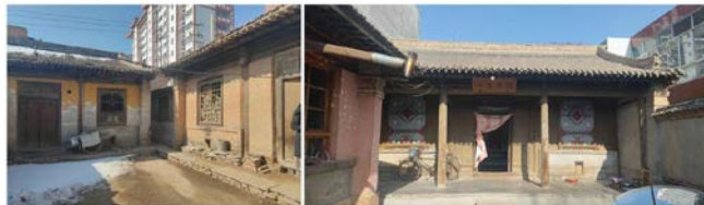
图1 现状传统民居建筑

通过实地走访调研，最早建于乾隆年间的徐氏民居 [3] 因年久失修已被拆除，目前保留较完整的民居建筑多为清末所建，如头天门巷赵氏民居、巩昌镇三元街42号马氏民居、北关正街张氏民居 [4] 等。清末建筑单体多为木框架夯土单坡面硬山建筑，多见3开间，单体建筑面积15-20m 2 ，进深5-8m，开间2.5-3.3m。建筑多设檐廊，山墙墙垛回收，通过砖砌盘头或设木质挑枋，使得建筑出檐远。屋面泥背仰瓦，设正脊，多数设垂脊。墙体较厚，内部夯土或土胚砌筑而成，外部使用黄土泥秸秆抹面。外露木柱、檩垫枋、木门窗均为素色（图1）。民国时期建筑也多沿用传统形制，仅在墙体厚度、青砖的用量、窗的样式、外墙涂料等有所变化。