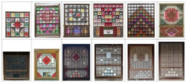
图4 传统民居窗户式样及对应剪纸样式