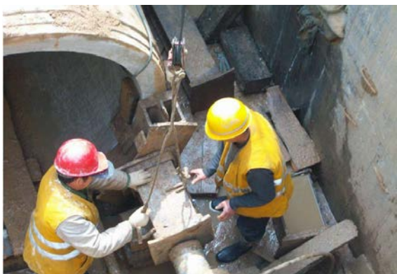
图1 市政给排水施工图

(1) 加强施工状况分析，积极开展现场组织管理活动，重视施工效果的科学评估，有利于降低给排水施工问题发生的概率，丰富市政工程建设内容，充分发挥给排水设施的实际作用，为城市基础设施完善过程中提供专业支持。(2) 深入思考顶管技术的应用，重视高素质施工队伍建设及专业优势的充分发挥，执行好切实可行的管控体系，有利于提升市政给排水施工及应用水平，为现代城市建设及发展中注入更多的活力，如图1所示。