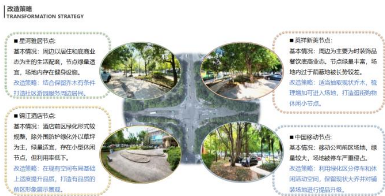
图5 汇兴路龙汇街交叉口改造策略

以闻香观花打造居民出门进园的乐活之春；以林下活动和商业展销为主的林荫之夏；以营造缤纷多彩的商业氛围、打造顾客休闲场所的时尚之秋；以阳光大草坪敞开酒店形象界面的阳光暖冬。