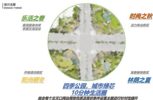
图6 汇兴路龙汇街交叉口设计主题