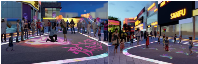
图7 五星街景观亮化效果图

建筑的亮化是对街道整个空间氛围的主要烘托。景观亮化则更加注重与人群的互动，通过最新的灯光技术手段打造出一条沉浸式互动灯光秀的街道，好看又好耍。结合LED屏植入手机互联互动功能，实现更多的参与性，比如浪漫的求婚，还有小朋友的积极参与灯光感应游戏互动。