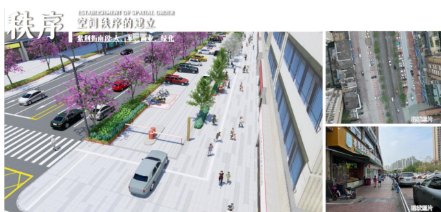
图4 紫荆路南段标准段设计

或者特色化，应该结合场地周边的特性，使用人群，及在地条件确定合理的功能及改造力度。