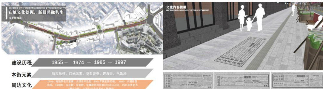
图8 五星街在地文化挖掘

除了历史文化挖掘，也考虑新旧结合。借助创新的设计语言，现代科技互动技术，实现场地过去与现在的对话，打造一个串联起场所的历史记忆，充满了清晰的云集路味道，又极具时尚开放与生机活力的城市空间。街区更新应拥有新旧相融、时尚与历史共存、烟火生活与潮流文化碰撞的特点。