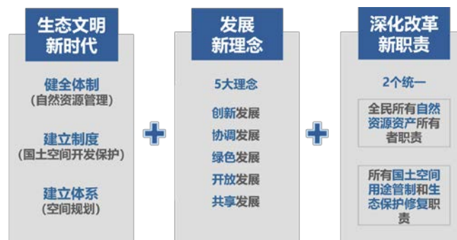
图1 新时代国土空间规划要求

国家国务院于2018年发布了《关于统一规划体系更好发挥国家发展规划战略导向作用的意见》，意见明确了发展规划和国土空间规划的关系，为二者发展指明了方向，为有关部门确立了推动二者协调发展的目标，以推动国家的可持续发展。同时，《意见》还为我们指出了规划制度改革发展的目标，即“一级政府、一本规划、一张蓝图”。为达成这一目标，各级政府需切实履行自身职责，确立清晰的政府关系定位，构建协调互补、边界清晰的整体规划体系，以提升国土空间规划的合理性。建立系统和谐的国土空间规划机制有助于推动社会经济的协调发展，政府部门需通力合作，制定合理的国土空间规划方案，搭建“人口——资源——环境——生态”同步发展的规划格局，进而促进国土空间规划工作的持续发展 [1] 。