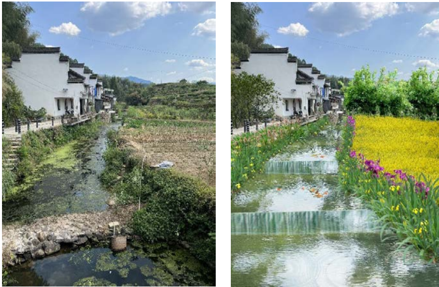
图1 村前小河整治前后效果对比图

飘进千家万户。结合送戏下乡，开展扶贫政策宣传，各类系列宣传活动纷呈，让村民“长知识、爱家乡、有获得、真幸福”，让传统文化活起来，文化场所热起来。