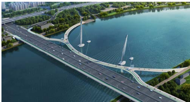
图四 方案二 空间索面斜拉桥

人行桥在西侧为直线桥，东侧曲线布置，以大半径坡道与滨水漫道衔接。行人骑行漫步较为舒适。东侧主桥采用双塔斜拉桥，主梁为钢梁，主塔为曲线钢塔，索面为空间索面。东侧主桥双塔间距132m，塔高60m。单侧桥宽8-10m。