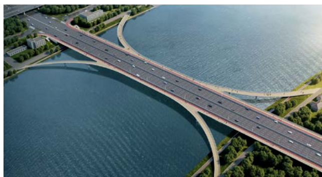
图六 方案四 曲线钢箱梁桥

方案象征沈阳如同列车，平稳快速，高效迅捷地驶向目的地——实现东北的全面振兴、全方位振兴。