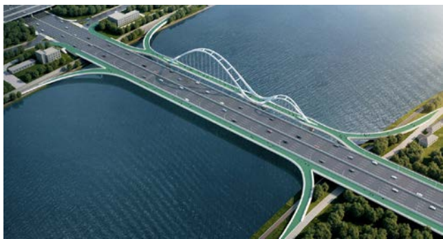
图五 方案三 双跨非对称拱桥

桥梁方案主题为钟灵毓秀。方案灵感来源于沈阳辉山和浑河。辉山气象万千，山峦起伏。浑河波光粼粼，奔流不息。本方案以映雪辉山化为银色起伏的拱肋，以奔流沈水倒映飘逸的主梁。山水相依，相映成趣。方案表达和人与自然和谐共生，绿水青山就是金山银山的主题思想。