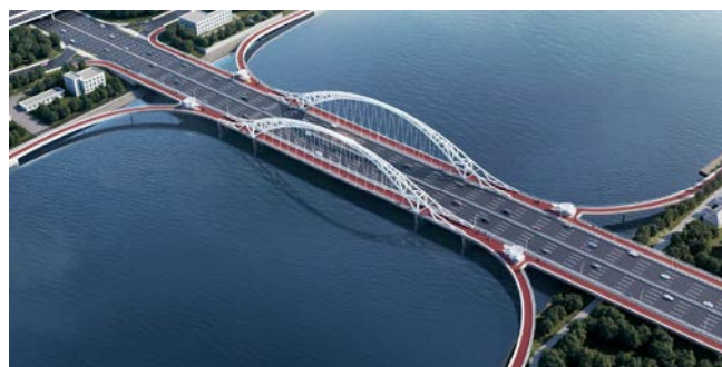
图三 方案一 对称提篮桁架拱桥

景观慢行桥主桥为提篮桁架拱结构，在车行桥东西两侧对称布置。慢行桥主桥总宽9m，慢行道净宽6m。跨径布置为33+132+33=198m。主跨为132m，主梁以上拱圈高度26.4m。矢跨比1/5。两侧以大半径坡道与滨水慢道衔接。行人骑行漫步较为舒适。