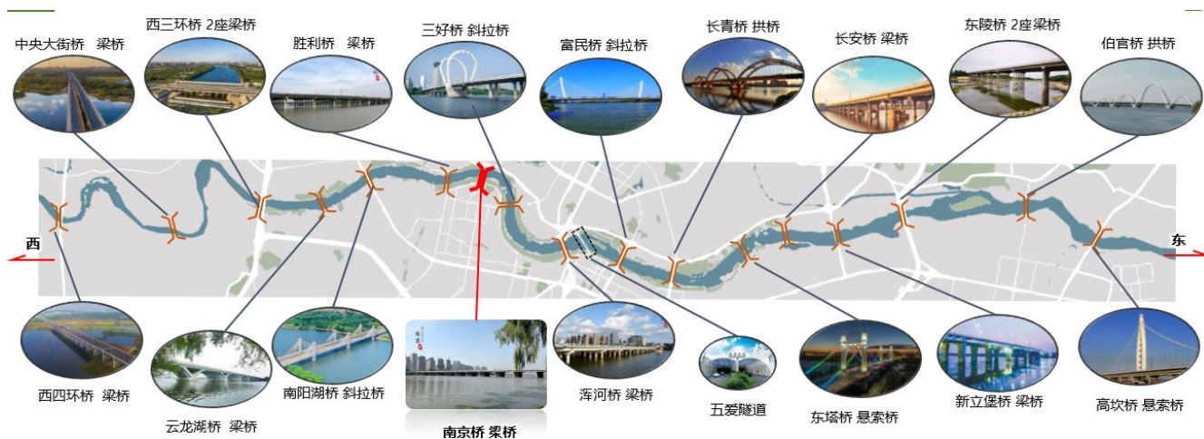
图一 沈阳市已建跨浑河通道分布图

虽然跨浑河桥数量众多，但仍不能满足浑河南部地区与母城交通通行的需要，尤其是在胜利桥、工农桥、