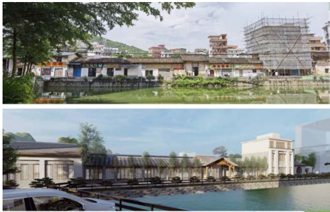
图3 乡居建筑改造前后对比图

规划以非物质文化遗产为抓手，为更宁里公园主要特色板块设计赋能。首先，保留村落原有布局，结合产业功能定位，统筹村庄群落，加强乡村人居环境营建，分类适度改造农房，保留现有古村落较好的土胚墙和青砖墙，进行加固、翻新、升级改造成乡村酒店及红色景点与活动中心，浓缩成能展现当地特色的设计元素，体现乡村建筑符号图案、色彩和风格的旅游观光产品（图3）。其次，以具有历史价值的建筑和街巷残垣断臂改的室外公共绿化空间为拾遗手作坊、吕头田酿坊、荔乡文创坊、从化猫师舞等非遗文化提供空间载体，梳理出酒店入住、游玩体验、展厅参观和原住民生活四种流线，根据活动流线串联整个更宁里公园，设计公园景观节点和配套服务设施，利用项目地非遗文化遗产和现代创意相结合，搭建非遗传承人与游客间文化互动体验，打造特色旅游体验项目，让非遗产品走进大众视野，实现人文价值与商业价值的完美结合。