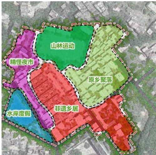
图1 更宁里公园景观规划功能分区

更宁里现状用地情况存在较多闲置空间，在景观规划空间布局优化时，将重拾古村肌理与风貌，整合乡居、水岸、山林等资源重新划分空间及赋予新的旅游产业项目形式，使整个村庄空间资源实现最大化的集约利用，同时赋予文化内涵，使从化非遗焕发新的生机和活力，寻求“乡村旅游+非遗保护”的新发展模式，进一步促进文旅产业的协调发展。因此，本次更宁里非遗公园的空间布局分为以食住行游购娱为主的非遗乡居、创意休闲度假的水岸度假、山林有氧运动的山林运动三大业态体系，再针对其合理的景观空间进行细化功能分区（如图1）。同时，根据三大业态空间布局为起点，深挖其非遗特色文化、温泉文化，加大保护力度，根据新的文化赋值扩大生活业态，最终生长出新的旅游业态（如图2），使得更宁里乡村空间既有原真性文化元素，又符合现代生活方式的文化空间。