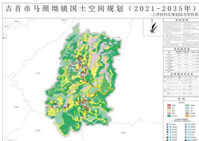
图2 马颈坳镇上坪村村庄规划综合管控图

“镇村一体”规划作为一种编制组织方式,满足不单独编制村庄规划区域的需求,其规划成果是在乡镇国土空间规划成果的基础上,增加村庄部分的规划内容,形成“一图两表一说明”的村庄层级规划成果,即村庄规划综合管控图,核心规划指标一览表、近期建设项目表及规划说明。