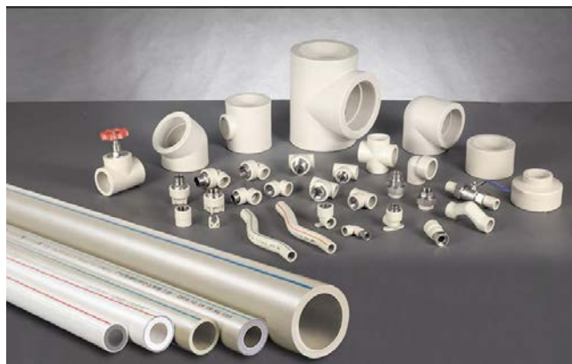
图二 给排水工程用管材及附件

给排水工程的质量管控，应该从常用管件材料质量、管道安装连接质量、器具设备安装质量等方面抓起，常见的关键材料如图二所示。在正式开工之前做好安装设计与准备，预留管道的预埋位置，管道与支架预制，然后正式开始管道安装与测试，过程中要严格管控好管材质量，做好工艺技术的把控，才能综合提升给排水工程建设质量。