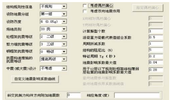
图3 地震信息设置界面图

为了方便描述地震信息内参数如何正确选择，设置界面图如图3所示。结构规则性信息这一项先按不利计算即不规则计算。当对结构进行第二轮计算时，按照结构的计算结果结合规范中规则和不规则的有关判定对比分析，来界定结构是否规则，按实际情况填写。在偶然偏心作用下结构的位移比超过1.2 认为是不规则，小于1.2 认为是规则的，影响放大系数的问题。设计地震分组根据抗震规范附录A选取即可。场地类别可根据甲方提供的地质勘察报告确定此项参数。抗震设防烈度结合工程所在地根据地震动参数区划图查询，结构抗震等级根据抗震规范表6.1.2查取。偶然偏心和双向地震是如何选择的，首先考虑偶然偏心，进行分析计算，若偶然偏心下位移比值大于1.2，还需选择双向地震作用，重新计算配筋。若偶然偏心下位移比值不大于1.2，则只需要考虑偶然偏心，无须选择双向地震作用。计算震型个数要保证“有效质量系数”大于90%，表明我们的震型数取得够多，一般取楼层数的三倍。在框架结构、框剪结构及开洞剪力墙结构中周期折减系数是不一样的，建筑填充墙使整个结构实际刚度要比模型计算刚度大，实际周期比计算周期短，周期长直接导致地震力大小偏小，若不折减实则计算出的结构偏于不安全，周期折减系数直接关联地震影响系数。若建筑结构采用石膏板甚至更轻质隔墙，这类隔墙刚度很弱，此时周期折