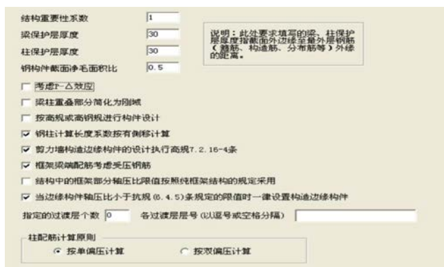
图4 设计信息设置界面图

为了方便描述设计信息内参数如何正确选择，设置界面图如图4所示，结构重要性系数，根据可靠性设计统一标准：对安全等级分别为一、二、三级时，重要性系数分别为1.1、1.0、0.9；梁柱保护层厚度跟环境类别有关，根据混规表8.2.1混凝土保护层最小厚度表确定。结构是否考虑P-Δ效应，pkpm程序会自动验算，在WMASS.OUT 中得出结论，若不满足规范要求选择该项重新计算重力二阶效应影响下的结果。梁柱有重叠区域能否简化为刚域要满足一定的条件，即柱截面一般大于1000mm或者柱子形状为异形柱需考虑该选项。在计算柱子配筋结果时按单偏压计算就可以，结构不规则时考虑双偏压复核，还有就是角柱或者异性柱子按双偏压计算。