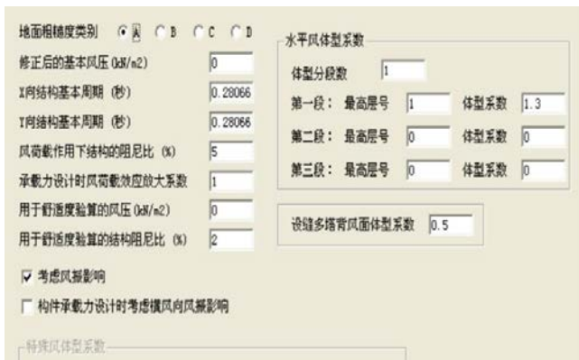
图2 风荷载信息界面图

为了方便描述风荷载信息内参数如何正确选择，设置界面项数如图2中所示，地面粗糙度类别根据建筑物所在地理位置可将其粗糙类别分为A、B、C、D 四类，根据建筑结构荷载规范就可得知建筑物所在地的地面粗糙类别，进行修正后的基本风压确定：不管60米以上还是60米以下算位移都是用50年一遇的风压，大于60米的配筋用基本风压的1.1倍采用，小于60米的用50年一遇的风压。X向和Y向结构基本周期刚开始计算时，无需设置，通过计算分析得出的两个方向基本周期结果输入到该界面对应的X向、Y向基本周期重新计算。风荷载作用下结构阻尼比按程序默认值即可。