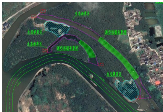
图1 生态涵养区平面布置图

按此原则，锦江绿色航道项目在黄屋电站下游、丹霞电站下游、夏富村3个河段的河道或者河道支叉处建设生态涵养区，涵养区总面积共约40.89万 m^2 。黄屋电站至双合水村2.4km河段由于开发价值不大，本项目建议建设为生态涵养区，保持原河道特性，避免采取任何工程措施，维护自然生态环境，为丹霞锦江各类生物提供良好的栖息环境；丹霞电站下游河中洲滩有两沟叉，水深较浅，岔道宽度较小，且沿线岸线开发程度低，生态环境较好，基本无船舶交通流；夏富村河道岔道较长，水域面积较大，沿程沟壑较多，周边岸坡稳定，地势平坦，生态环境较好，适合作为生态涵养区选址。3处位置通过采取适当的宣传与管理手段，营造相对宁静的外界环境的可能性较大，实施生态涵养区建设的可行性较高。