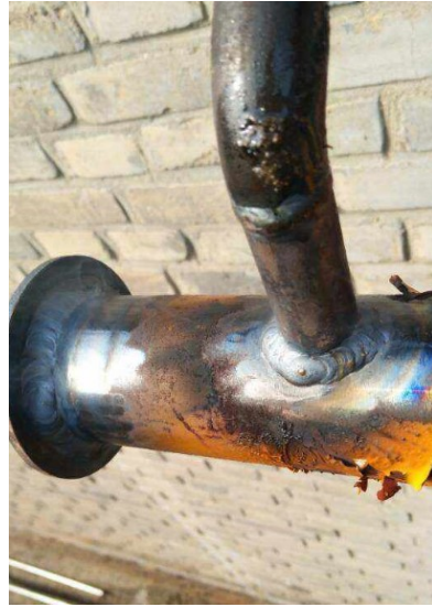
图一 燃气管道焊接作业

与材料设计的可靠性。施工中关键部位由安全检测部门采取抽样送检的方式进行保护，为燃气管道工程质量管理起到重要保障作用。