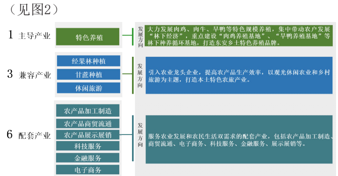
图2 东安村“1+3+6”产业体系构建图

产业兴旺是乡村振兴的关键。东安村在巩固传统农业——水稻、玉米、甘蔗、南瓜的基础上，做大做强特色养殖主导产业，推动发展兼容产业，支持引导配套产业，实现产业发展“重点突出、兼容有序、配套完善”，以“1+3+6”产业体系充盈乡村产业之“实”。（见图2）