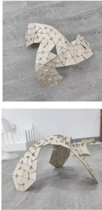
图4 壳体结构模型

从上文壳体结构景观小品从找形设计到拼装建造的全过程可以看到：结合参数化设计工具进行壳体找形和方案深化，结合数控加工技术进行模型建造，是一种行之有效的设计思路；对于不具备充分力学和结构知识背景的建筑师而言，相较于传统的手工模型制作，运用相关软件进行复杂曲面的找形设计和曲面壳体的平面化网格处理和构件排布，借助激光切割技术完成平面构件拟合的模型建造，是一种过程更高效、表达更清晰的设计方式。