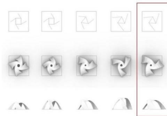
图2 不同初步方案壳体结构形态比较（图片来源：自绘）

通过上述流程完成了一个初步方案的结构找形，确定了一种的壳体形态。从不同初步方案出发，重复这一流程，完成多个不同骨架形式、不同骨架高度、不同受力特壳体结构形态比较，最终选定受力合理且形式美观的一组进行后续设计，比较过程和结果如图2所示。