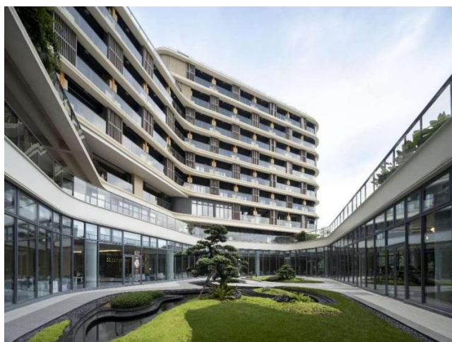
图3 和泰安养中心公共花园