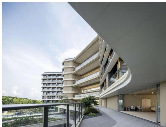
图4 和泰安养中心走廊