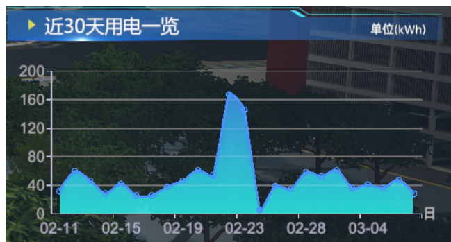
图2 用电情况一览图

另外，三维可视化技术还支持能源数据的时间序列展示，能够将历史数据与实时数据相结合，形成动态的能源图景。这种时间维度的数据分析使得管理者能够观察能源系统的演变过程，追踪能源消耗的变化趋势，预测未来的能源需求，从而更加有效地规划能源管理策略。