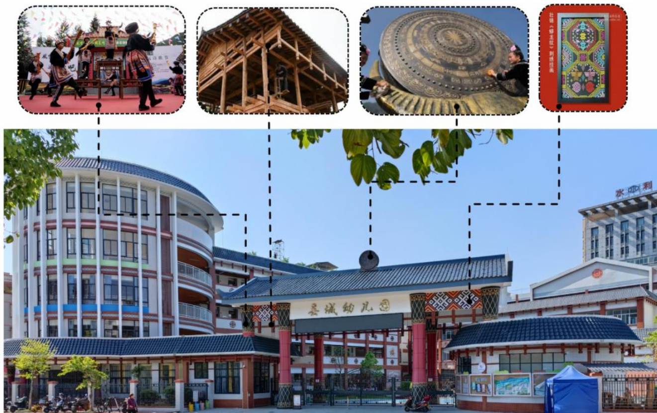
图3 建筑形式和民族元素展示