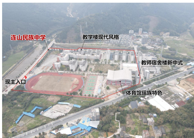
图1 连山民族中学建筑类型

受到现代建筑文化的影响，连山县城很多新建的政府机构、医院、学校等公建项目，均大量采用了较为简单直接的建筑立面，甚至部分教育建筑采用了南欧地区的建筑元素。例如连山地区的连山民族中学校园建设周期长达10余年，校园前期规划以现代风格为主，但随着当地经济提升而带起的文化自信，校园后续建筑开始逐渐使用壮瑶民族元素，但也造成了一个校园内部同时存在现代风格、新中式、壮瑶特色等多种混搭建筑，风格较为杂乱，难以形成统一的、有序的和系统性的城市建筑风貌（图1）。