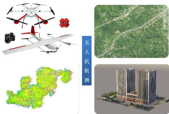
图3 某地籍测绘项目利用无人机航测技术获取的测绘成果示意图

实现在最短的时间内生成数字地形图, 适合地形复杂、面积大、不适合外业操作的地籍测绘作业项目。以地籍测量区域面积非常大的项目为例, 在地面影像摄取期间, 需合理利用航拍机器设备, 进一步在外业判读的基础上, 构建相应的地面模型 [8] 。在构建好模型之后, 合理采取计算机绘图软件, 对模型进行量测, 最终获取准确的数字地形图。采取此类数字测绘技术方法, 可以将大量外界测量作业转移至室内, 在此情况测绘工作人员无须出户便可以实现对外界测量作业的有效控制, 且成图速度快, 可获取高精度数字地形图成果, 成本相对低廉。因此, 为获取工程所需的航测数字成图, 有必要合理科学应用航测数字测绘技术。如下图3所示, 为某地籍测绘项目利用无人机航测技术获取的测绘成果。