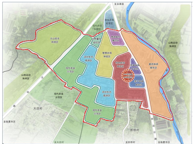
图1 村域产业发展规划图

规划以乡村旅游为主导产业，以特色种植为配套产业，针对祁牟村乡村现状旅游要素，对照“吃、住、