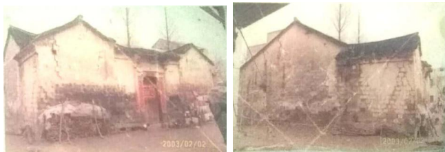
图2、图3 五房台村五栋老宅之一

这里的民房大部分都是小开间长进深，大部分为木构建筑，而较早建立的老房屋则是三开间砖砌小合院，以这个体量看过于小巧，然而这些现象表明至少在江汉平原修建较为坚固的房屋是一种“奢侈”，由于水患影响，对盖房子本身的态度不够积极。在这样的环境下，住宅如以青砖灰瓦建设本身就是一种高规格房屋了，笔者在族人资料里找到了一张祠堂图，由祠堂图所绘来看，其规格大小都远不及其湖北其他地区的巍峨高大，但是它确实证明了这种青砖灰瓦的“住宅”确实是当地人民认知的“高规格”形式。