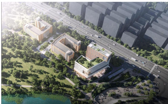
图3 湖南工程学院科创大楼鸟瞰图

结合场地原始竖向，双塔楼连接位置底层架空，打造景观大台阶，既能够让其他校区的师生通过木鱼湖人行步道便捷进入科创大楼，同时消解了高层对于围合庭院的压迫感（见图3）。