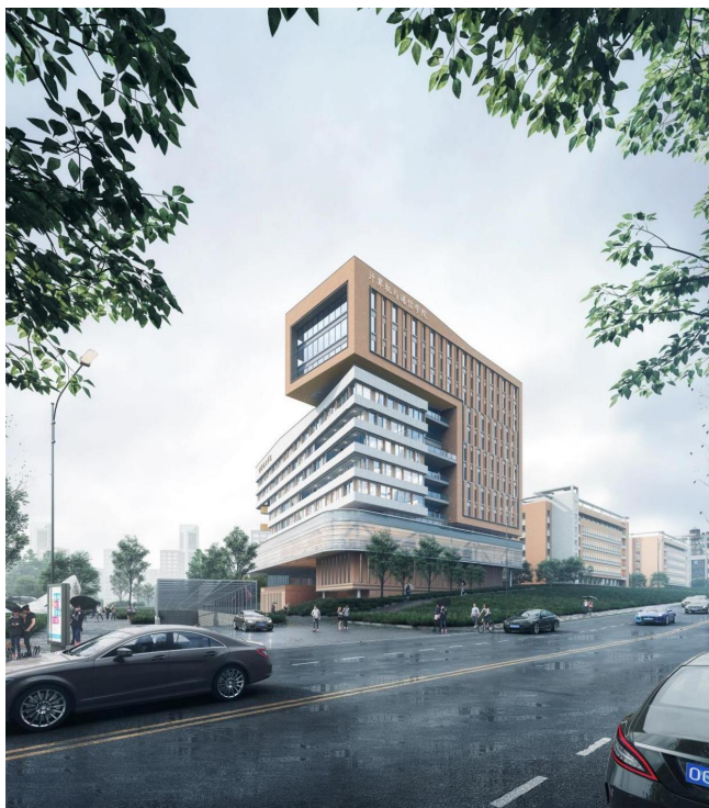
图2 湖南工程学院科创大楼沿街透视图

结合场地原始竖向，双塔楼连接位置底层架空，打造景观大台阶，既能够让其他校区的师生通过木鱼湖人行步道便捷进入科创大楼，同时消解了高层对于围合庭院的压迫感（见图3）。