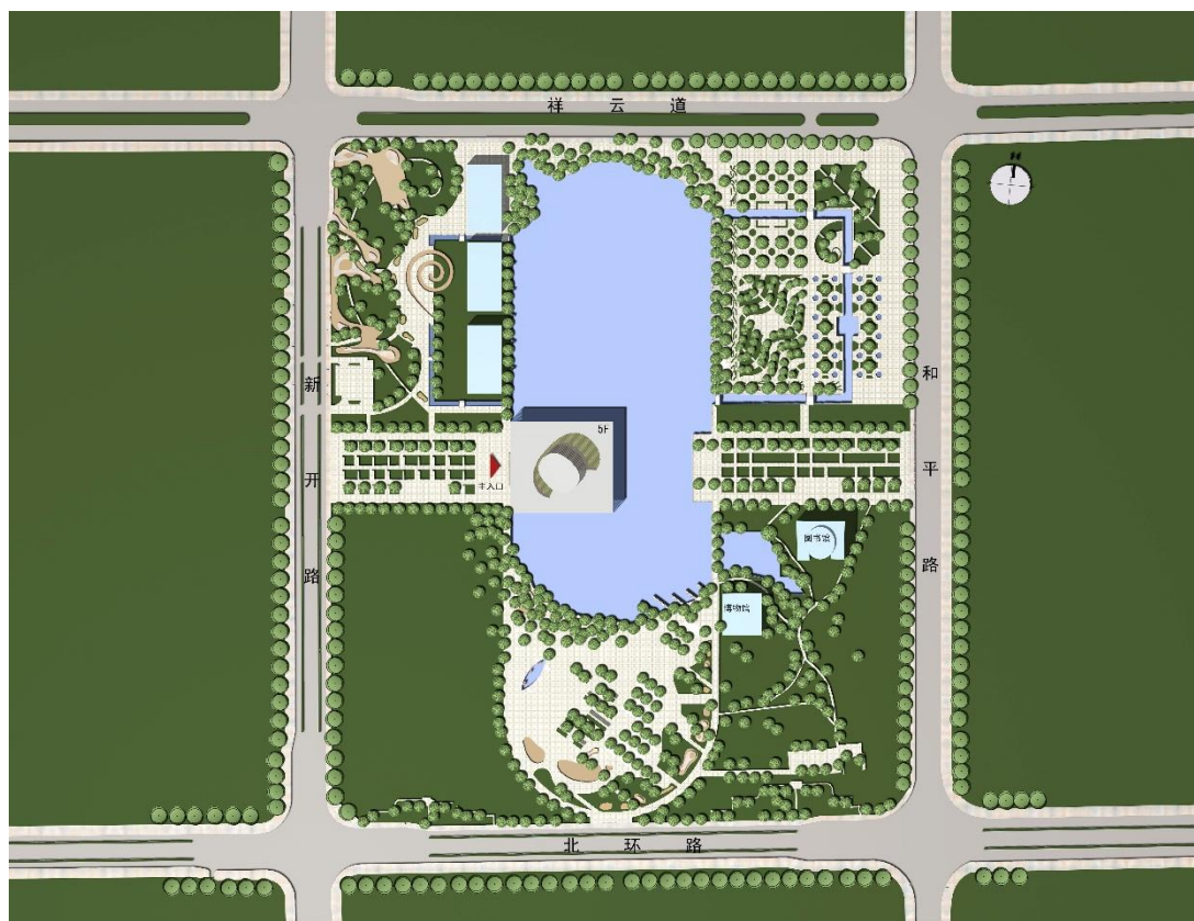
图4 位于城市公园核心的建筑布局

廊坊大剧院命运多舛，在2007年无限期停滞之后，最终在2012年又迎来了转机，政府主导重新启动立项研究，社会资本新奥集团巨资投资，在原址文化艺术中心的北侧选址扩容建设“梦廊坊大剧院”，也称“廊坊丝绸之路国际文化交流中心”，规模高达19万平方米，包括：主题音乐广场、综合剧场、儿童剧场、博物馆、美术馆、地下车库等附属配套设施，这也为曾经的“廊坊大剧院”赋予新生。