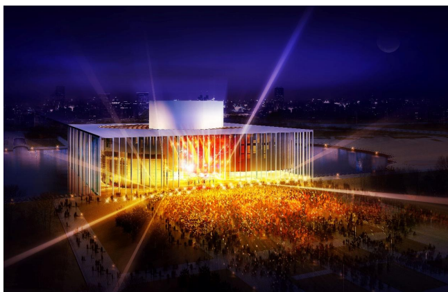
图3 与市民文化广场融合

廊坊以建设“园林式、生态型、现代化”强市名城为目标，规划选址与环境布局别具心意。项目位于城市文化艺术中心公园最核心位置，梦幻湖西侧，湖面轻盈悬挑 100米×100米方形地块，北、东、南三侧均悬于湖面，其独特的环境将廊坊生态、园林的气质彰显的淋漓尽致，将剧场文化托举至最高、表达至极致，典雅、生动，赋予艺术气息。廊坊大剧院，她静静地伸展在梦幻湖上，必将成为这座园林式宜居生态名城的名片。