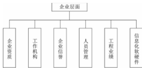
图1 企业层面评价指标

⑥新技术的应用能力。目前，以BIM、CIM、物联网等新型技术在建筑行业中的不断更新和更新，因此，企业必须要拥有良好的新技术运用和信息管理水平，这样才能跟上世界的步伐，增加自己的市场占有率，为发展全过程的工程监理服务。