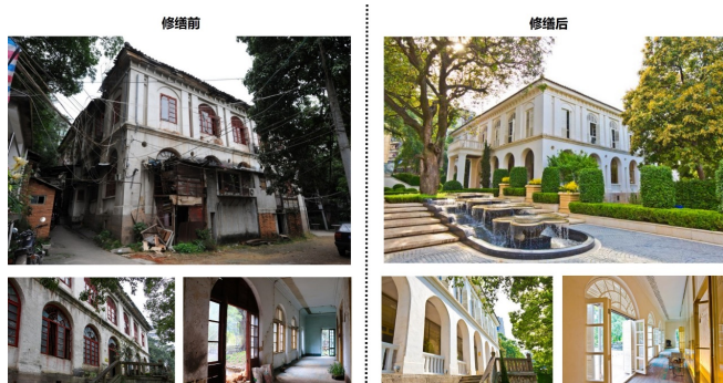
图2.1 历史建筑修缮前后实景照片

大庙山至烟台山新建建筑高度和城市景观，处理好历史风貌区与滨江景观建设的关系。严格保护近现代发展形成的历史街道，历史建筑和总体风貌，保留传统街巷格局的有机性及丰富性。并沿仓前路对现存标志性文保建筑进行修缮保护。除此之外，保留并突出标志性历史建筑作为天际线制高点。