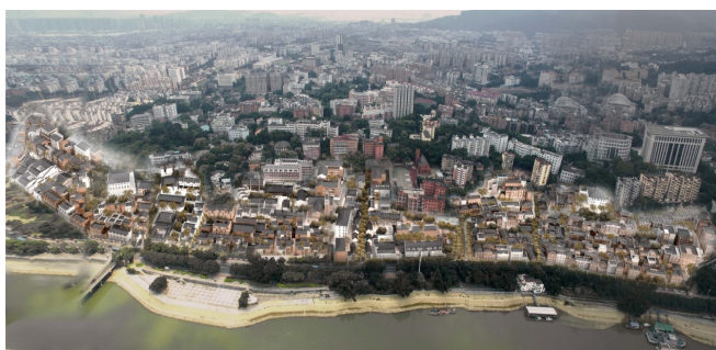
图2.3 烟台山建筑屋顶织补

通过研究烟台山记忆中九巷的特征，以不同历史时段为出发点，通过大与小的尺度空间来呼应中与西，营造万国风情，织补与整合仓前街沿江特色风貌建筑。以历史碎片为核心营造出各具特色的空间组团，并延续屋顶组团模式使各分区互有联动性。以保留建筑为核心发展出各具特色的建筑簇群，并以屋顶将建筑组团串