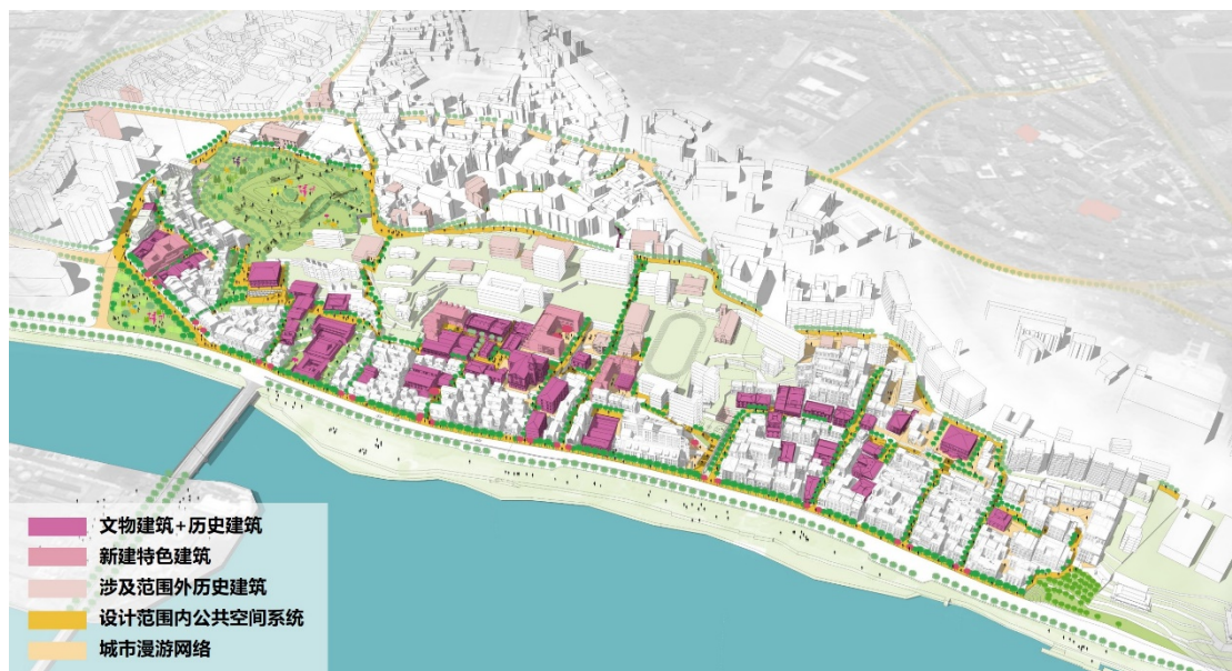
图3.1 烟台山人文趣城网络