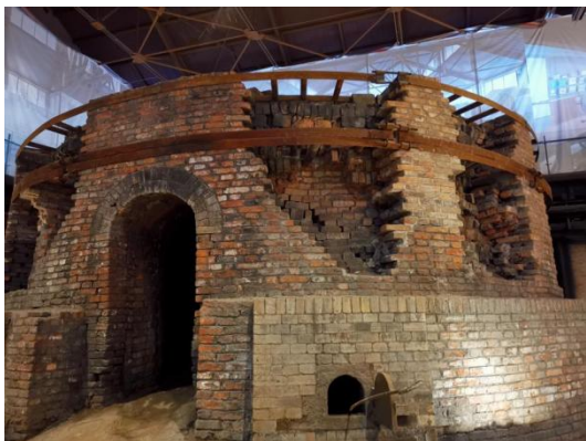
图2 宇宙瓷厂工业遗产博物馆圆包窑

从以上案例不难看出，旧事物与新空间是两个概念的对比。旧的是传统的窑炉设备，新的是全新的设计理念与模式，对比是工业与后工业，传统与现代设计的差异融合才呈现出对比效果。新旧空间与景物有机结合，