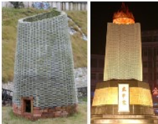
图1 太平窑和景德镇市里村路口“太平窑”城雕

“窑炉”元素展现的是景德镇陶瓷文化内涵。因此城市建筑与景观设计围绕着陶瓷文化而展开，因而有社会性、传承性、地域性等特征。同样，当“窑炉”元素运用于建筑与景观设计中，需要采用适宜的设计手法。既可以通过借用传统窑炉的形象展现景德镇陶瓷文化的工艺价值与历史深度，也可以提炼窑炉的造型元素进行抽象、夸张处理，还可以采用窑炉的砌筑手法进行解构（图1）。具体作如下分析：