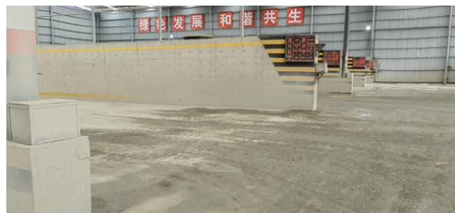
图1 横向排水沟淤堵

搅拌站料仓在初步设计阶段排水措施设置不规范，后期补充的排水系统效果不明显，无法及时排除砂石料含水；料仓进口位置设置的横向排水沟长期淤堵，冲洗地面多余的水容易越过排水沟流入料仓；细骨料由于毛细作用，顶层和底层含水量差别大。